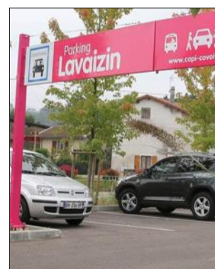
Le covoiturage préconisé pour les Journées du patrimoine.

Les personnes sondées seront soit interrogées par téléphone, soit directement à leur domicile. Celles des territoires de la Capi et de ViennAgglo seront consultées à leur domicile. Les autres le seront par téléphone. L'enquêteur sera muni d'une carte professionnelle. Tous les membres du foyer de plus de 5 ans seront interrogés pour les entretiens à domicile. Tous les déplacements de la veille seront recensés, ces données restant confidentielles.