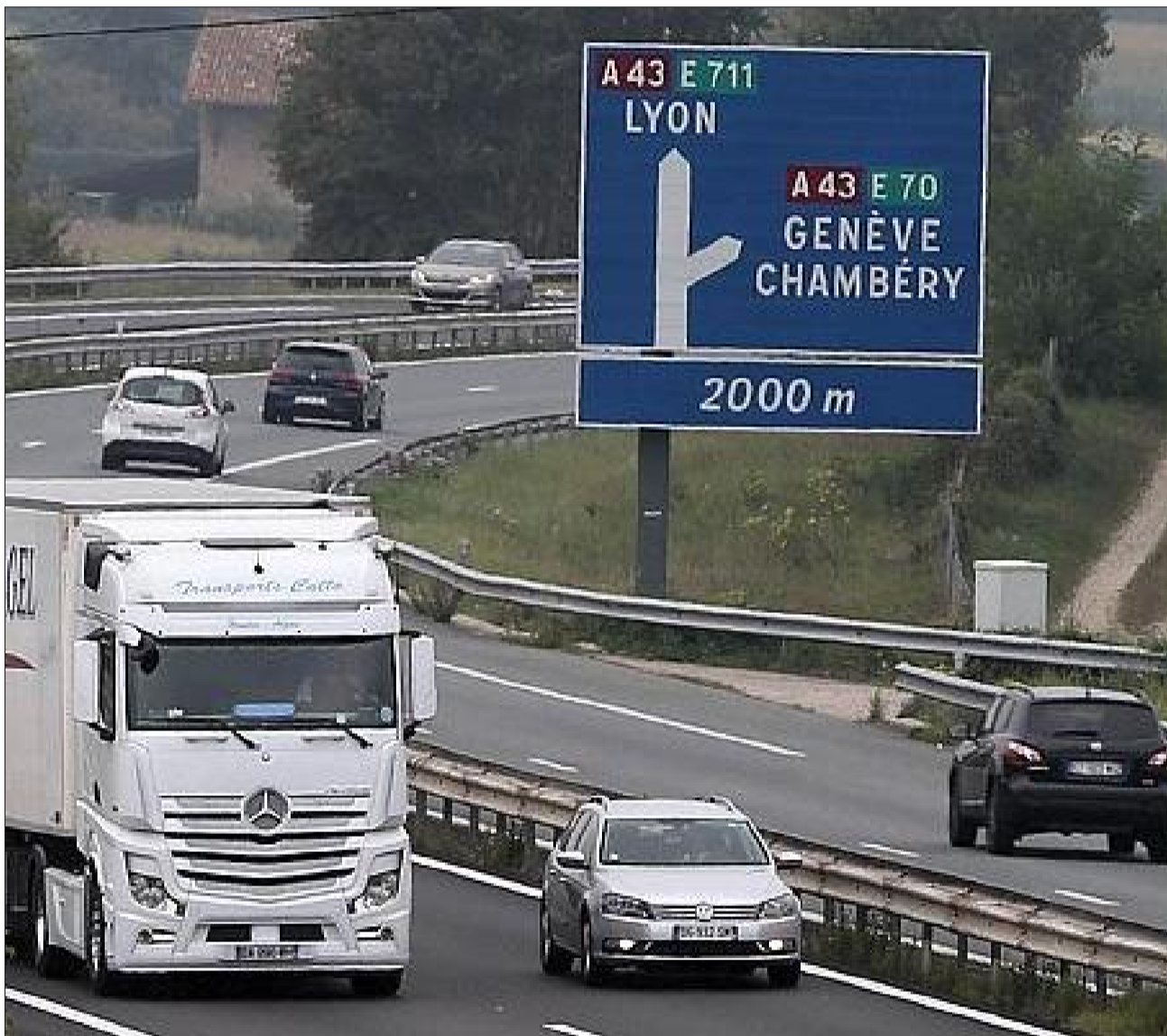
Dès le 7 octobre, une enquête va étudier les déplacements des Nord-Isérois et des habitants de l'agglomération lyonnaise.